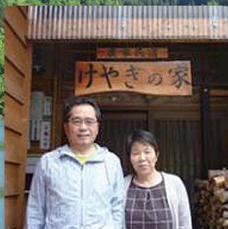
宿泊施設 / 外観イメージ