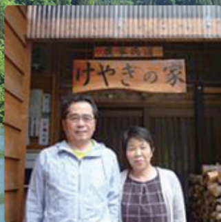
宿泊施設 / 外観イメージ