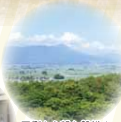
西側から望む磐梯山