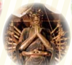
会津ころり三観音: 立木観音