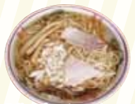
名物:冷やしラーメン