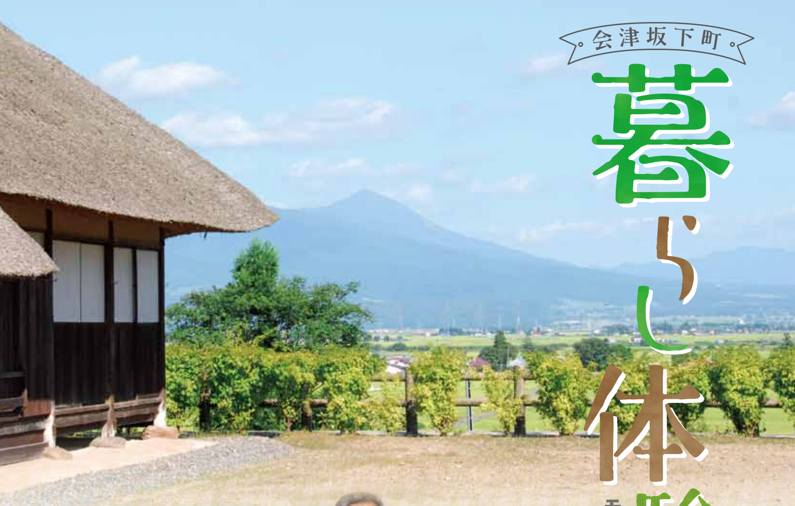
旧五十嵐家住宅(国指定重要文化財)より望む景色