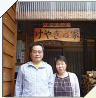
宿泊施設 / 外観イメージ