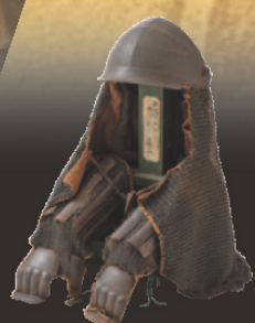
鎧帷子・籠手 土方歳三使用 (土方歳三資料館蔵)