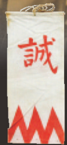
新選組袖章(聖山歴史館蔵)