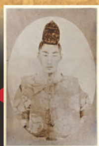
松平容保写真