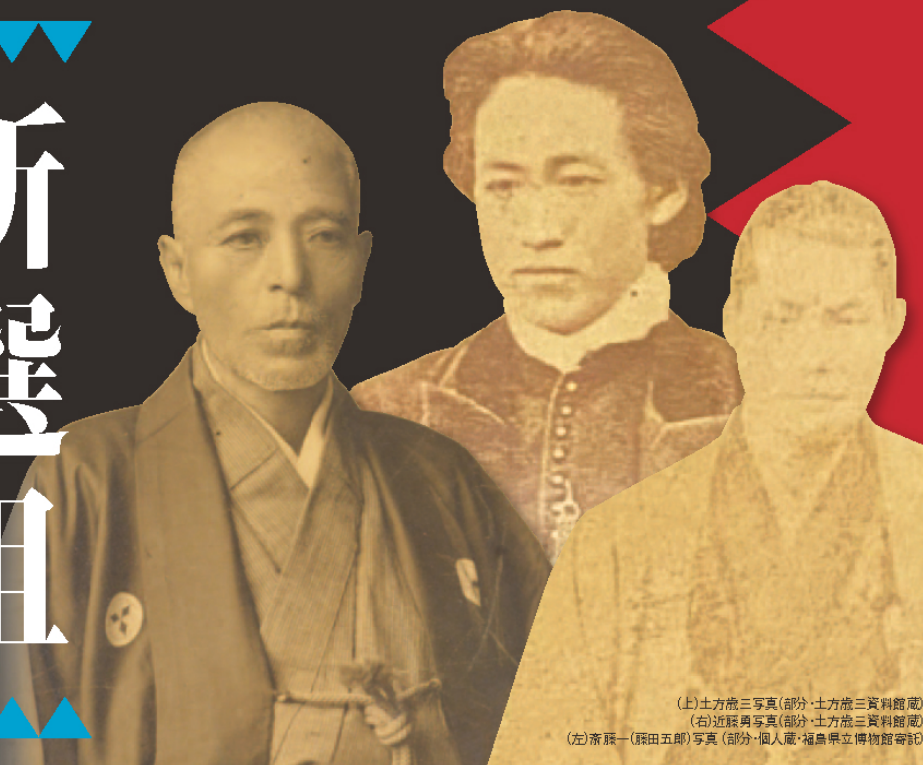
(上)土方歳三写真(部分・土方歳三資料館蔵) (右)近藤勇写真(部分・土方歳三資料館蔵) (左)斎藤一(頼田五郎)写真(部分・個人蔵・福島県立博物館寄託)