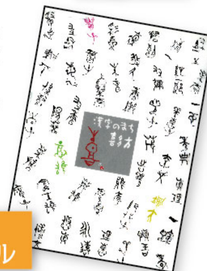
古代文字クリアファイル