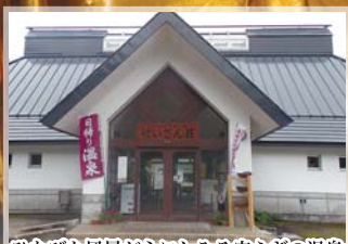
ひなびた風景が心にしみる安らぎの温泉 西山温泉 せいざん荘(柳津町)