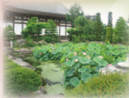
龍興寺 蓮池「華芳園」(会津美里町)