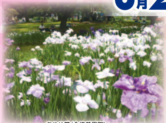
あやめ苑(会津美里町)