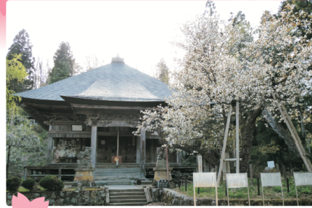
虎の尾桜 会津五桜の一つで花は八重咲き。おしべが花弁化する珍種。