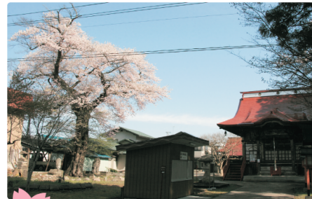
文殊院知恵桜 樹高が高く、美しい濃紅色の花弁が見事です。