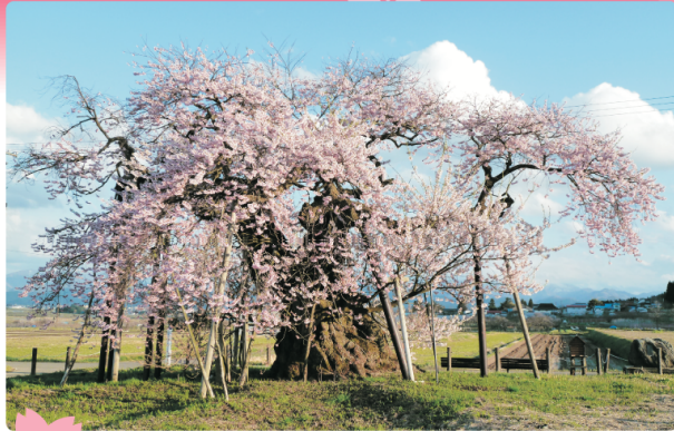
米沢の千歳桜 県の天然記念物にも指定されている樹齢約700年のベニヒガンザクラ。

郡山駅発着 日帰り おひとり様(昼食付) 2,000円 (税込) ※応募者多数の場合は抽選となります